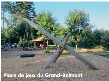
Place de jeux du Grand-Belmont

Comme vous avez certainement pu le constater, le réaménagement de la place du Grand-Belmont est en cours. A ce jour, le couvert est monté ainsi que quelques jeux. Le financement de cette place est assuré pour la plus grande partie par l'Etat de Fribourg, qui en le maître d'œuvre) pour un montant de 65 000 francs. Le projet est soutenu par l'association Penser forêt – Agir Bois pour une somme de 15 000 francs, par la Corporation forestière de la Basse-Broye (15 000 francs) ainsi que par les quatre communes qui formeront Belmont-Broye pour un montant de 20 000 francs. La fin des travaux est prévue pour l'automne 2015.