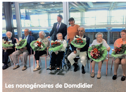
Les nonagénaires de Domdidier